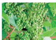
Pre-fioritura (calipre presenti)