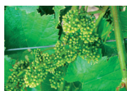
Inizio fioritura (10% calipre cadute)