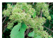
Piena fioritura (50% calipre cadute)