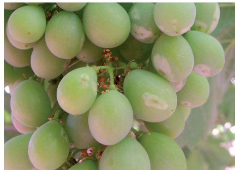
Danni da Tripide su Uva da tavola